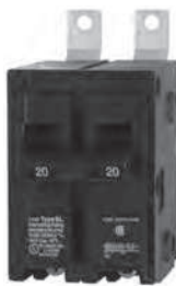
2 - Polo