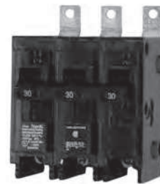
3 - Polo