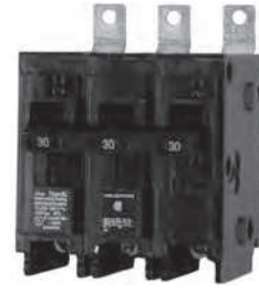
3 - Polo