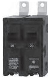
2 - Polo